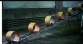
Fischli et Weiss